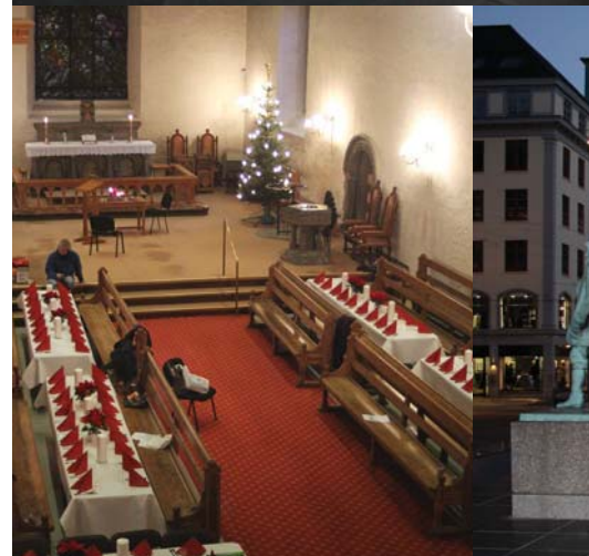
JUL I KORSKIRKEN: Slik ser det ut i Korskirken julaften, med juletre og pyntete bord. Bildet er tatt like før gjestene kom til julaftenfeiring i 2012.

dre må opp og rydde og ordne for å føle seg vel. Det er opent for å vera - og opent for å gjera.