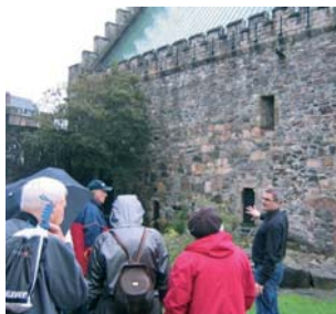
Aktiv Fritid på besøk til Håkonshallen.

I neste menighetsblad, som kommer ut i februar, blir det mer detaljer om vårens program. ●