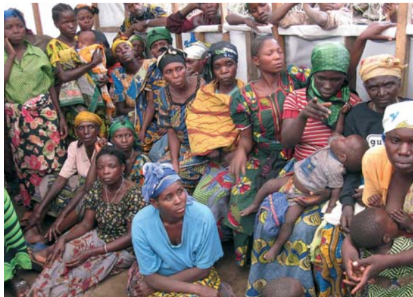
FLYKTINGER: Kvinner på flukt i eget land, her i leiren Minova utenfor byen Goma.

PÅ SKOLEBENKEN: Kirkens nødhjelp lærer flyktingekvinnene å lese og skrive, og gir dem opplæring i enkelte praktiske håndverk. Tanken er at de skal kunne starte sin egen virksomhet når de kommer hjem igjen.