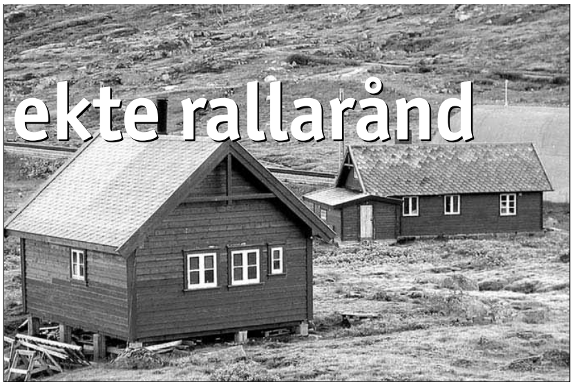
Kongsnuthytten med Sikringsbuen til venstre og jernbanen i bakgrunnen.