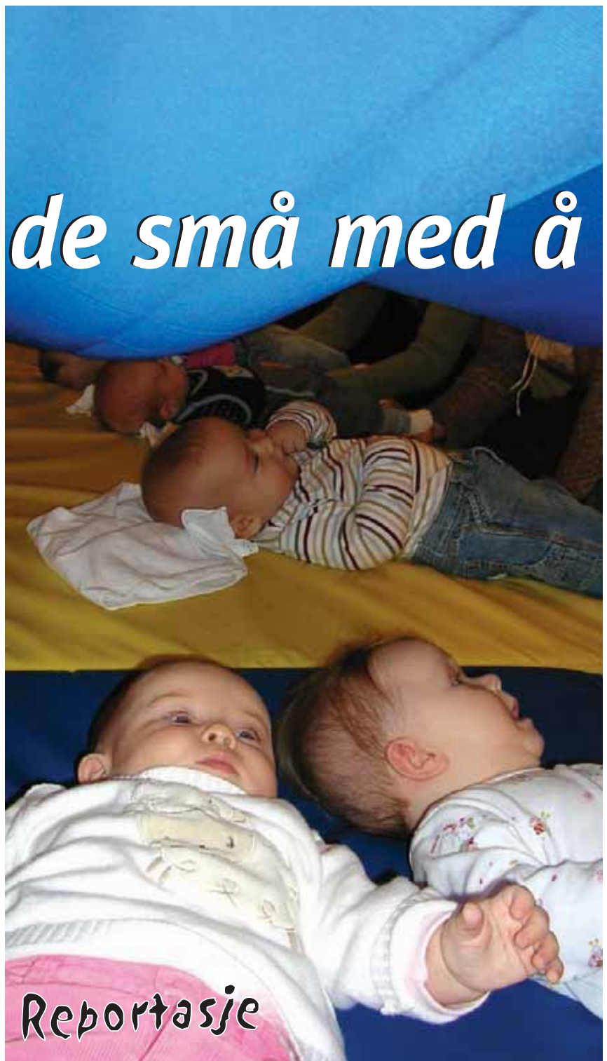
Det er babysang i Skjold menighet. Mødrene vaier silkelakenet over babyene, som griper etter det blå.

des rundt. Det klirres for David og for mamma og instrumentet sendes vi- dere, sirkelen rundt. Her blir hvert barn og hver en mor sett.