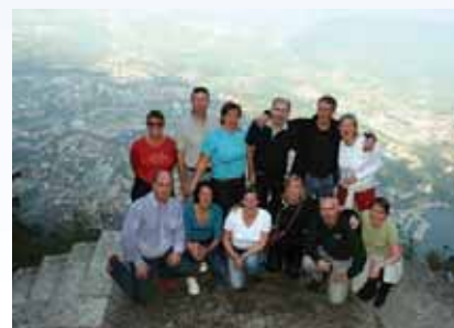
Utsikten tar pusten fra oss i dobbel forstand ved St. Barbara. Riva del Garda i bakgrunnen.