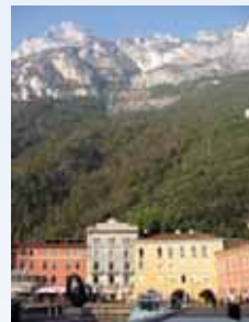
Utsikt fra hotellet mot fjellene rundt Riva del Garda