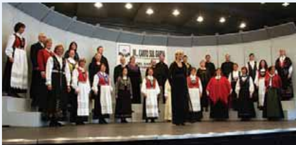
Sola Fide fikk æren av å synge på avslutningskonserten for over 2000 tilhørere.