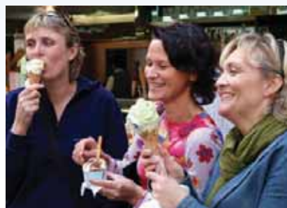
Ingen kan motstå, gelato - italiensk is. Vi er i Sirmione, en koselig liten by ved Gardasjøen.