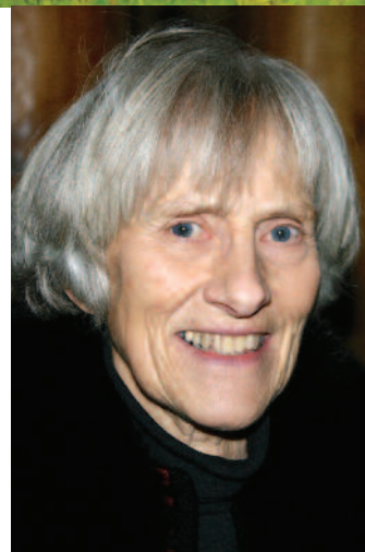
PRIMUS MOTOR SIDAN STARTEN: