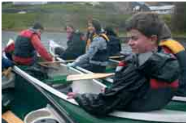
Friluftsliv gir friskt mot og fellesskap.

Et av årets konfirmanttilbud er «høstferiekonfirmant». Det vil si at mesteparten av undervisningen fant sted i høstferien.