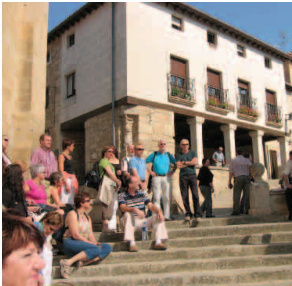
Siesta i solveggen i Santo Domingo de Silos før omvisning og gregoriansk messe i klosteret