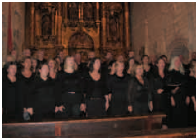
Bøneskoret holder konsert i Stiftkirken i Covarrubias.