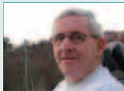
Lien: -Lav deltagelse gjorde aktiv kumulering effektiv