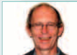
Vaula: -Vi trenger en radikal omlegging av valgsystemet.