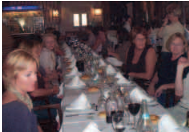
Bøneskoret nyter en av de flotte lunsjene under oppholdet i Spania.