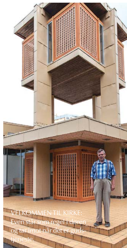
VELKOMMENTIL KIRKE: Even står som regel i døren og tar imot når det er guds- tjeneste.

Menighetsbladet vil presentere og gjøre litt stas på noen av de mange flotte frivillige medarbeiderne i menighetene. Tidligere har vi møtt ildsjeler i menighetene i Fana, Skjold og Storetveit, denne gangen er stafettpinnen i Søreide. Deretter går den videre til Slettebakken, Bønes og Birkeland.