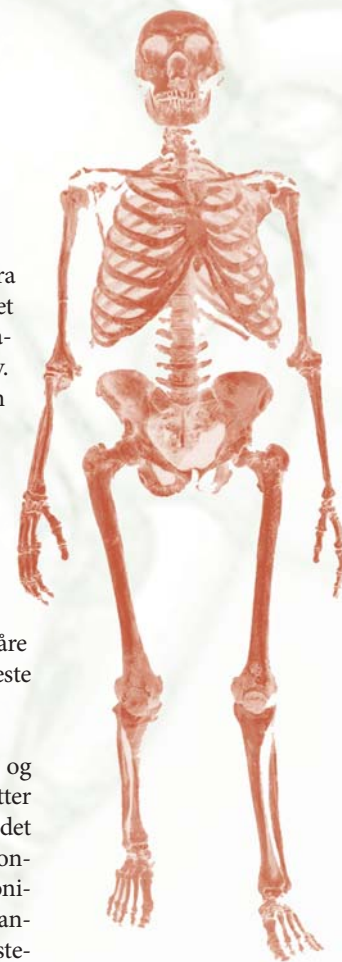
TUNGVEKTER: Rekonstruert skjelett av neandertaler, basert på beinfragmenter fra en rekke ulike funn

mennesker, bort sett fra afrikanere. Det siste er et paradoks i seg selv. Hele den menneskelige evolusjonshistorien fant sted i Afrika, og det er også her vi fortsatt finner våre aller nærmeste slektninger (sjimpansen, bonobo og gorillaen). Etter at vi forlot det afrikanske kontinentet, kolonisererte vi alle andre tenkelige steder på vår vidstrakte klode. Uten noensinne å se oss tilbake. Og neandertaleren? De siste sporene etter dette urfolket er bare 25.000 år gamle, og ble funnet i Gorhamhulen i Gibraltar-klippen - med utsikt over til det tapte afrikanske kontinent. ●