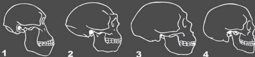
MENNESKETS UTVIKLING: Hodeskaller fra australopithecus (1), homo erectus (2), neandertaler (3) og moderne menneske (4). ILL: V. P. VOLKOV

• Vår art, homo sapiens («det tenkende mennesket»), oppstod i Afrika for rundt 250.000 år siden. Vi utvandret fra Afrika for rundt 80.000 år siden, og har siden spredd oss til alle verdenshjørner.