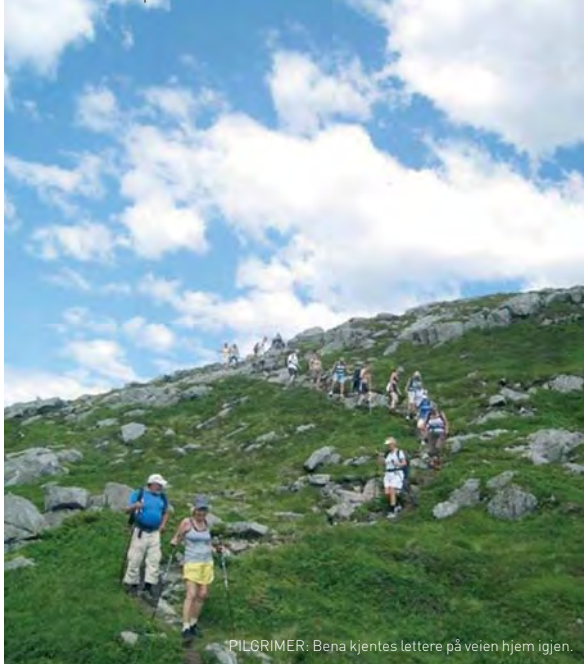
PILGRIMER. Bena kjentes lettene på veien hjem igjen.