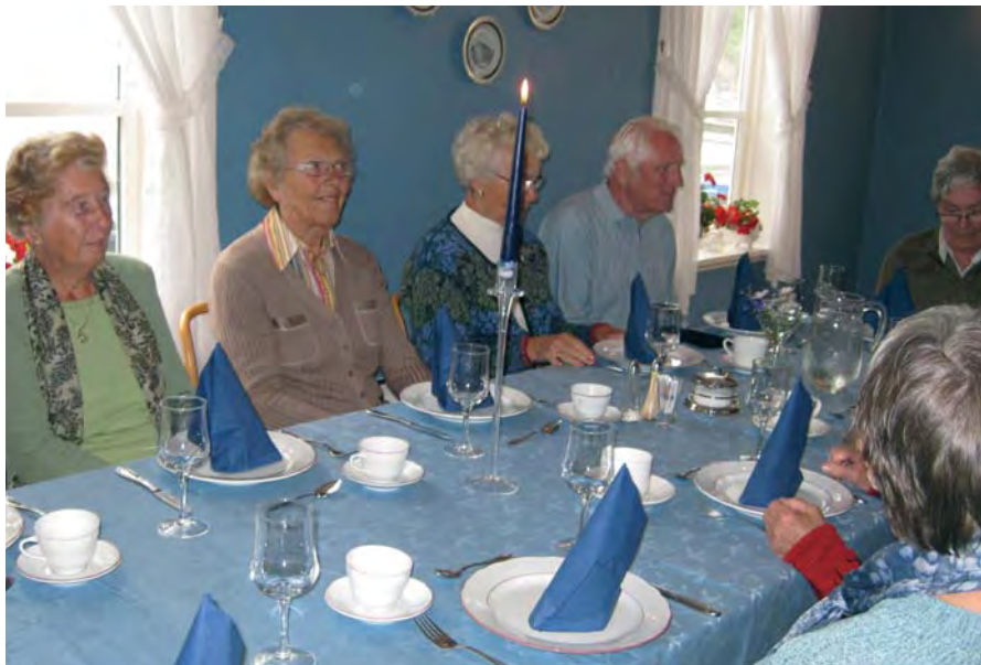
Herlig laksemiddag ble servert på Bekkjærk Gjestgiveri.