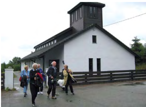
På besøk i Hundvåkøy kyrkje.

To særlige stoppesteder ble det anledning til. I Håndvåkå kirke – en ny lun og god kirke å være i - fikk turdeltakerne lunch, orientering om kirken og noen ord til ettertanke. I Bekkjærk ble den lengste stoppen – et sted med vel bevarte gamle bygninger og