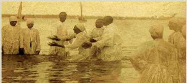
ELVEDÅP: Forfulgte europeiske immigranter tok bapptisn med til USA, der den protestantiske trosretningen i dag teller rundt 32 millioner medlemmer. Postkortet viser en elvedåpssermoni i Nord-Carolina ved inngangen til det 20. århundret.

– Ikke alle, men noen får et litt annet lys på seg når tiden går, sier han, og forteller at en god tekst å bruke i møte med det meningsløse er Jesu siste ord på korset (Matt.27:46).