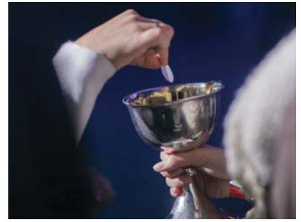
SAKRAMENT: Over 1,3 millioner gikk til nattverd i DNK i fjor.

Her må jeg melde pass. Dette kan jeg ikke greie. «Nei vel,» sier læremesteren, «men du er tilgitt av vår Far i himmelen uansett. Du er elsket av Gud som hans barn. Det får være nok for deg». ●