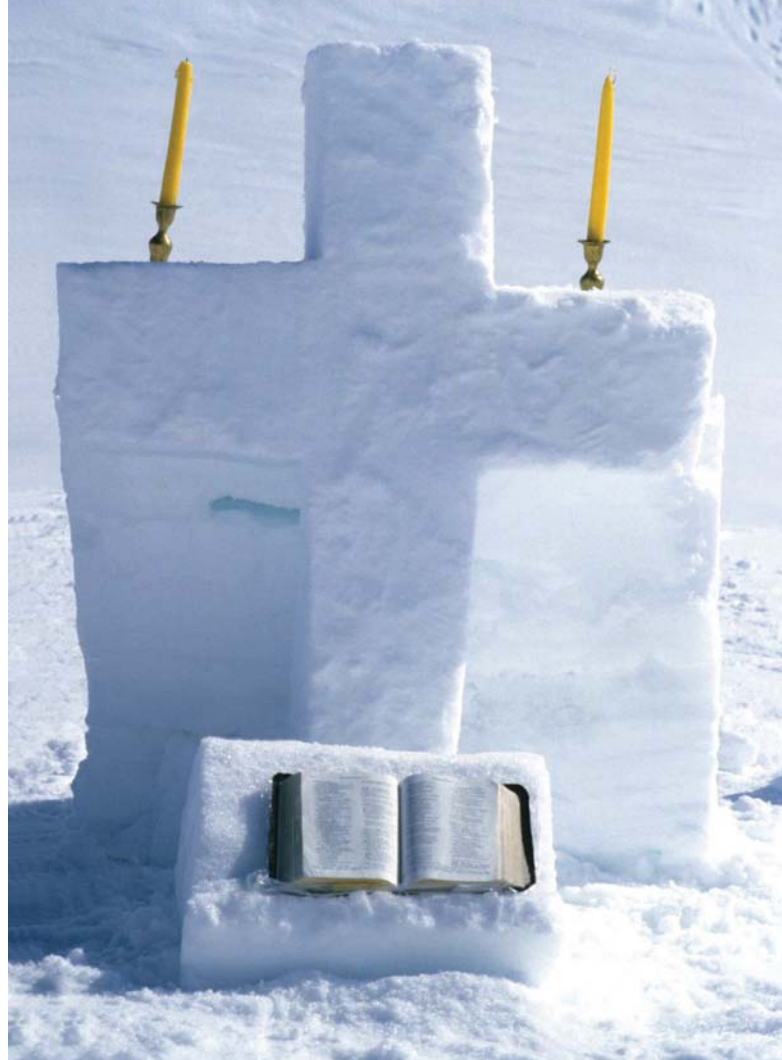
Alter i snøen: Fra en av klubbens mange påsketurer.

Som et uttrykk for hva Klubben har betydd og kan utfordre til, tar vi med et minne som en «klubbis» har skrevet: