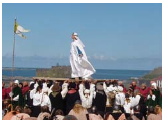
PÅ FLUKT: Sunniva ber Gud om hjelp til å flykte frå vikingkongen Ramn.