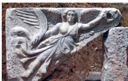
SEIERSGUDINNE: Den greske seiersgudinnen Nike ble tilbedt i Efesos. I dag hylles hun av joggere og sprintere over hele verden.

kom til Efesos (se Apg. kap. 19). Han ble årsak til store opptøyer, siden han forkynte Jesus framfor Artemis. Hans preken kostet ham nesten livet. Efesos nevnes også i Johannes åpenbaring (Åp. 2:1-7), samt nabo-byen Smyrna (Åp. 2:8-11).