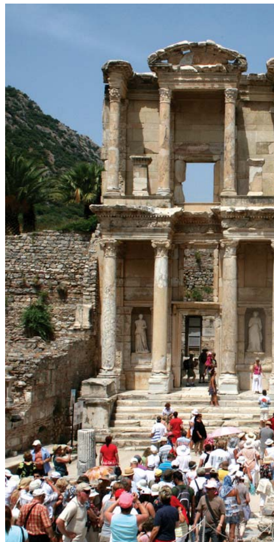
CELSUS-BIBLIOTEKET: En gang verdens tredje største bibliotek, bygget som en monumental grav for senatoren Celsus (ca. 45-120).

Den gang byen blomstret, var den et knutepunkt for handel og turisme. Kjente «turister» som Aleksander den store, Aristoteles og dronning Kleopatra besøkte byen. Store religiøse fester samlet folk flere ganger i året fra hele den kjente verden. Også Paulus