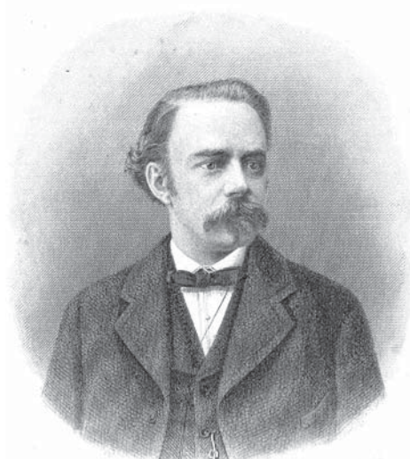
Carl David af Wirsén

Men du, o Gud, som gjør vår jord så skjønn i slike stunder, gi at jeg akter mest ditt ord og nådens store under! Som blomst og løv blir muld og støv, skal vi og verden fare, men Herrens miskunn vare.