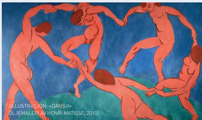
(ILLUSTRASJON: «DANS II», OLJEMALERI AV HENRI MATISSE, 2010)

• «Da jeg så tempelet til Artemis som steg opp til skyene, mistet alle de andre underverk sin glans» skrev Antipatros av Sidon, som satte opp listen over oldtidens syv underverker. ●