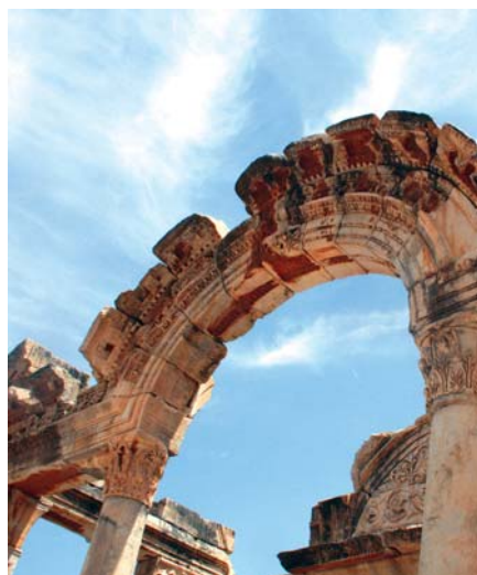
ARTEMISTEMPELET: Bare noen søyleres-ter er igjen av den en gang så praktfulle bygningen.

En gang var det hundrevis av butikker på hver side av gaten. Nederst finner vi apoteket med verdens eldste logo, en buktende slange, som fortsatt brukes av apoteker verden over. Bakgrunnen for dette symbolet