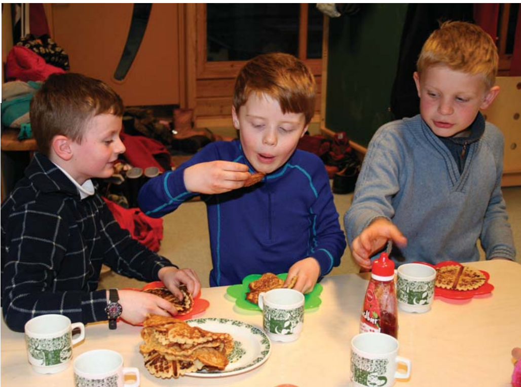
KULA OG MYGGEN: Annenhver onsdag samler en gruppe barn seg til Kula og Myggen barneklubb i Eldshovden barnehage. Klubbkveldene slutter alltid med en matbit. Denne kvelden var det vafler som stod på menyen.

går det slag i slag med undervisning, lek og formingsaktiviteter. De lærer å bruke Kristuskransen, og får grunnleggende kunnskap om trosbekjennelsen, Fader vår og sakramentene.