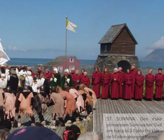
ST. SUNNIVA: Den irske prinsessen Sunniva ber Gud om hjelp til å flykte fra klerne til vikingkongen Ramm.