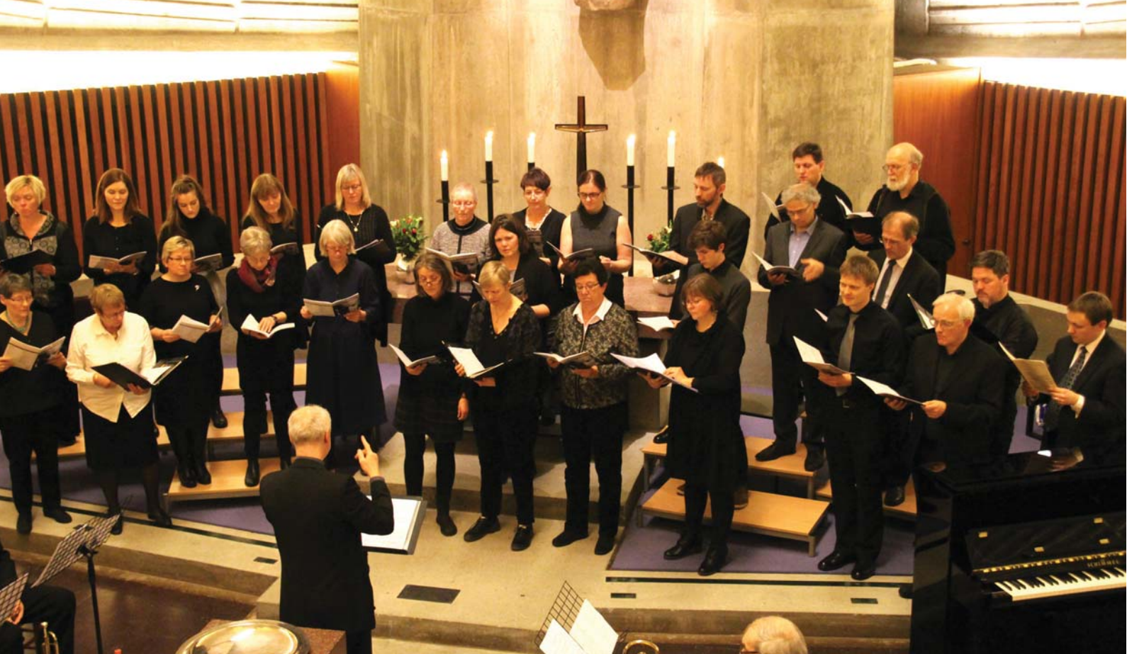
VAKKERT KORVERK: Motettkoret fremfører «Te Deum in C» av Benjamin Britten.