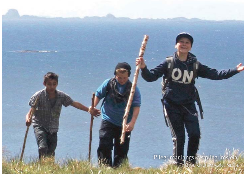
Pilegrimar langs kystpilegrimsleia.