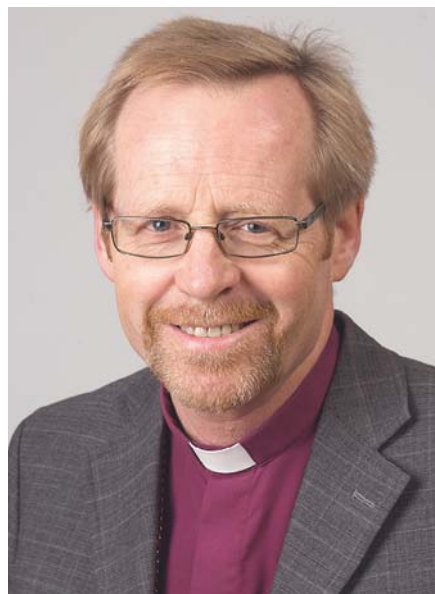
Biskop Halvor Nordhaug.