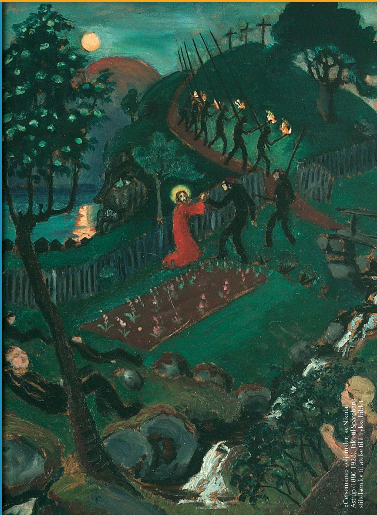
«Gætsmane» - oljemaleri av Nikolaj Astrup (1880-1928). Takktil Sparebankstiftelsen for tillatelse til å trykke bildet.

Snart er det full vår og konfirmattid i Bergen. Se side 22 for en liste over alle ungdommene som skal konfirmeres i Storetveit i 2014.