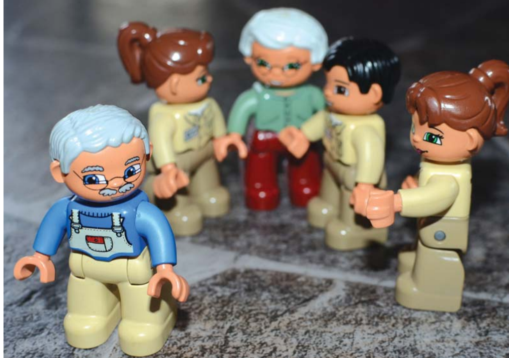
TA ANSVAR: Mobbing gror best i skjul; den misser noko av krafta når det blir tatt fram i lyset. Derfor er det viktig at vi tar opp dette temaet.

I dei felles retningslinjene som fleire kristne organisasjonar har laga med tanke på seksuelle krenkingar, står det mellom anna: « Et kristent menneske, som ved dåpen og troen er gjenfødt til et nytt liv og har fått del i den nye naturen, har fortsatt lysten til det onde i sitt hjerte. » Martin Luther beskriver denne realiteten med uttrykket «samtidig rettferdig og synder». Denne dobbelthe-