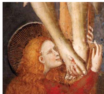
Marias påske - i Slettebakken kirke. MALERIUTSNITT TILSKREVET P. DA RIMIN