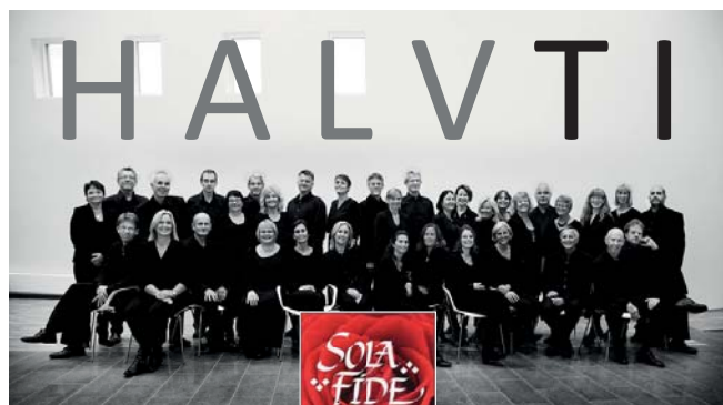
MINIKONSERT 25 år MINIKONSERT

Sola Fide fyller 25 år og i den anledning ønsker vi å invitere DEG til en gratis minikonsert på øvelsen siste torsdag i måneden i Søreide kirke.