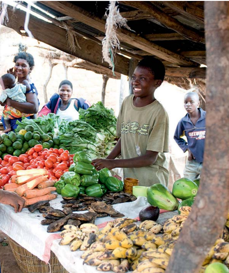
stå i grønnsaksboden for sin mor.