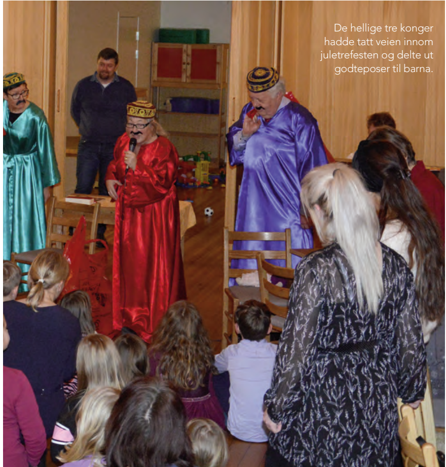
De hellige tre konger hadde tatt veien innom juletreffesten og delte ut godteposer til barna.