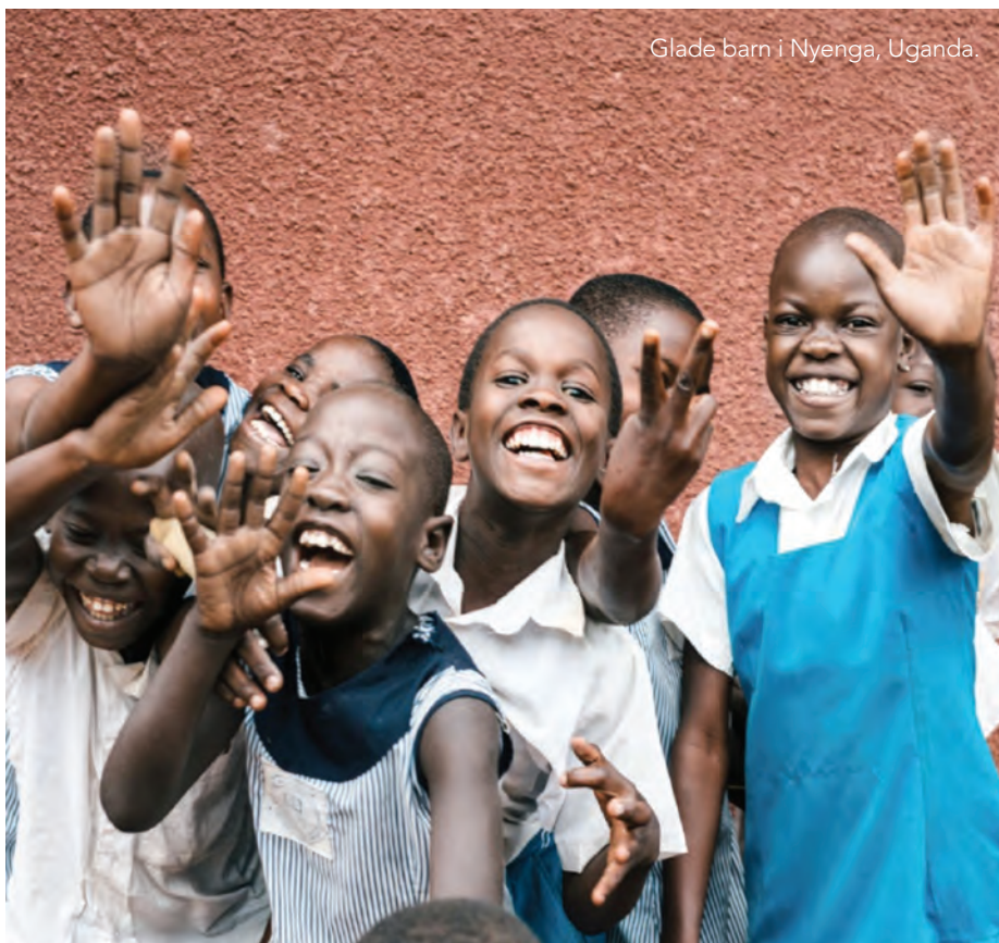
Glade barn i Nyenga, Uganda.

lokalsamfunnet for å bidra til lokal utvikling og etablering av nye arbeidsplasser i lokalmiljøet.