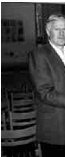
En fornøyd leder i Menighetsrådet, Ka

Fredag var bursdagselskapet. Alle stoler fjernet og langbord dekket. Mellom 2 og 300 benket seg og koste seg med pølser, kaker og kaffe, brus og topp underholdning. Kirke-