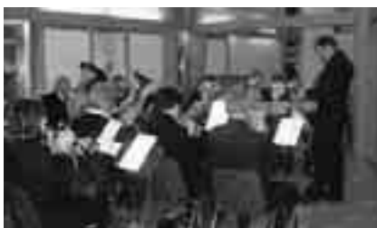
BOST var som vanlig med å sette farge på julekonserten