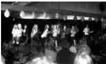
Tria gledet oss med en gjennomarbeidet kabaret.