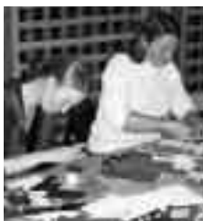
Mor og datter i dyp konsentrasjon på juleverksted.