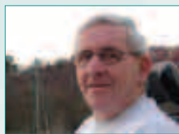
Lien: -Lav deltagelse gjorde aktiv kumulering effektiv