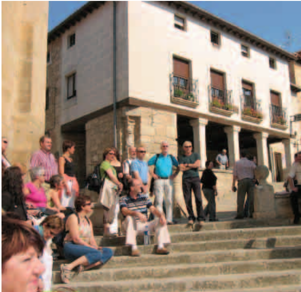
Siesta i solveggen i Santo Domingo de Silos før omvisning og gregoriansk messe i klosteret