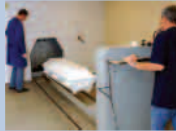
To mann kontrollerer alltid at papirene er i orden før kisten rulles inn i ovnen.