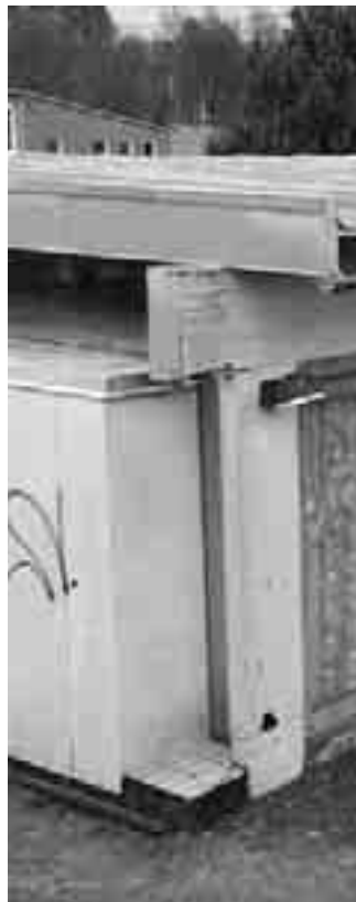
Nå er det bestemt at ungdomslokalet skal renoveres

- Målet er at bygget skal bli tjenelig for menighetens ungdomsarbeid fra nå av