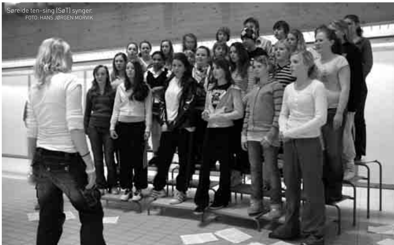
Søreide ten-sing (SøT) synger.

Akkurat nå er tensingen i full gang med å planlegge en markedsdag som skal være i mars. Da skal vi ha loddtrekning, bingo, loppemarked og kafè. Vi tror og håper at mange fra menigheten vil være med på dette, og samtidig hjelpe oss med å skaffe inntekter. Det kommer til å bli en kjempe-dag! ●