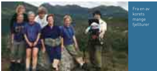
Fra en av korets mange fjellturner

- Tensing-koret startet like etterpå og mange var i flere år med begge steder. I tillegg ble mange av lederne i Ungdomsklubben med. Jeg tror de syntes det var fint å være med et sted hvor de ikke hadde lederansvar. En høsttur og én vintertur til Bergsdalen skule var en selvfølge i de 10-15 første årene, og disse samlingene har vært til uvurderlig betydning for koret.