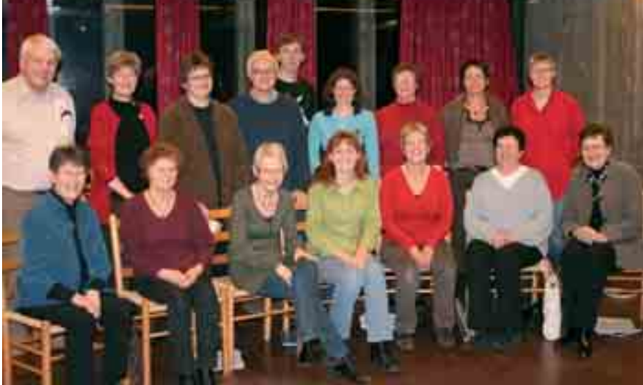
Fra øvelse i koret våren 2008.

- Kan du si noe om repertoaret i disse årene?