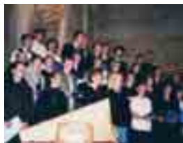
Konsert i Slettebakken 1998.

I 1988 var Barne- og Ungdomskoret både stort og godt – blant annet var det en stor gruppe 7. og 8.- klassinger. Fra disse kom det et nokså unisont krav om at de ville ha et kor med sopran, alt, tenor og bass som sang ordentlig 4-stemt korsang. I flere måneder i strekk minnet de meg på at dette var noe de ønsket. Oppstarten ble markert med weekendtur til Bergsdalen skule. Der øvde vi, gikk turer i fjellet og spilte ball på ulikt vis. Fra første stund sang også en del foreldre med i koret, og likt ble det et veldig godt miljø av. Siden har vi prøvd å opprettholde denne spredningen i alder blant koristene.