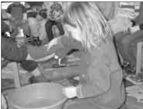
FOTVASK. som en del av «Kjærlighetens vei» «vasket» barna hverandres føtter.

Det blir mange flotte samtaler om dette i tiden før påske. Barna har virkelig evne til å tenke på andre og har mange forslag til hvor-