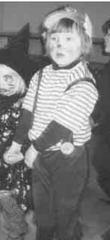
FASTE FESTER: Karneval i Slettebakken menighetsbarnehage.