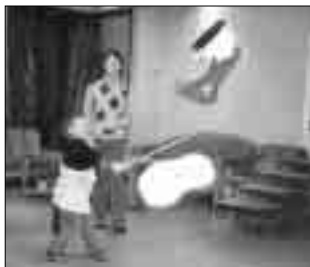
SLO HULL ...på hjemmelaget figur.

dan vi kan hjelpe de som ikke har så mye.