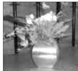
VASER. Vigelands vaser på plass i Slettebakken kirke.

Han har gjort flere bestillingsverk for kirker og har blant annet laget kirkesølvet i Skjold kirke her i Bergen og i Nore Neset kirke i Os.