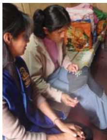
MEDMENNESKER: Agape-medarbeider og en lokal kvinne på sy-workshop.

Ofta er ikke menneskene her så mange muligheter generelt, og bare det at det eksisterer et tilbud her er uunnværlig.