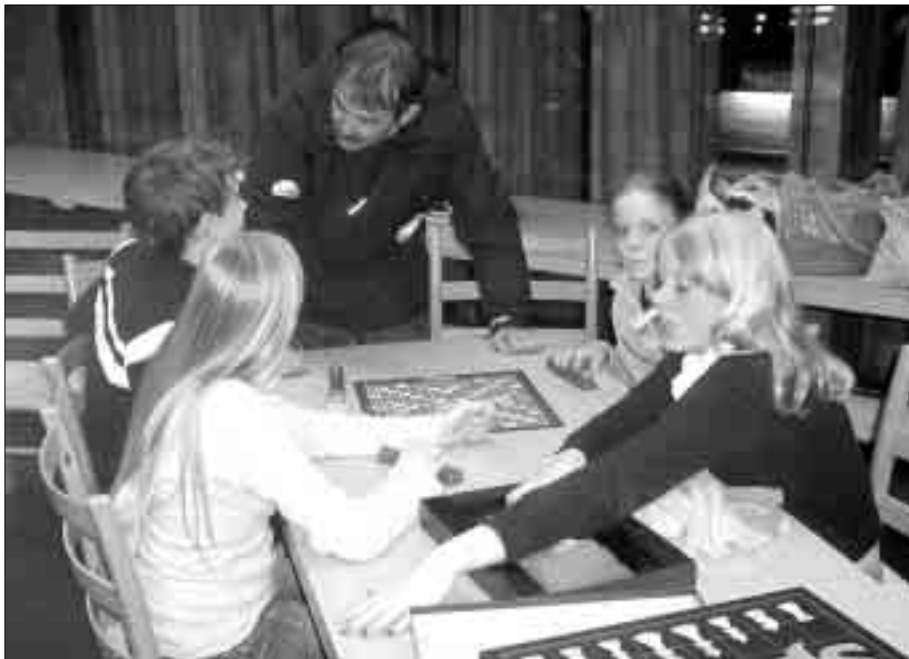
60.000! Pust i bakken-tilbudet får kommunal støtte.

ken. Natteravnene har gått ute hver kveld i høst, bortsett fra to fredagskvelder.