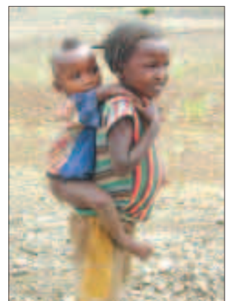
OMSORG: Han er ikke tung, han er jo min bror.

håp som et direkte resultat av dette arbeidet, gjør sterkt inntrykk. Jeg håper at inntrykkene, og den gnisten som ble tent i mitt møte med Afrika og Kirkens Nødhjelps bistands- og misjonsarbeid, i noen grad kan smitte over på konfirmante-