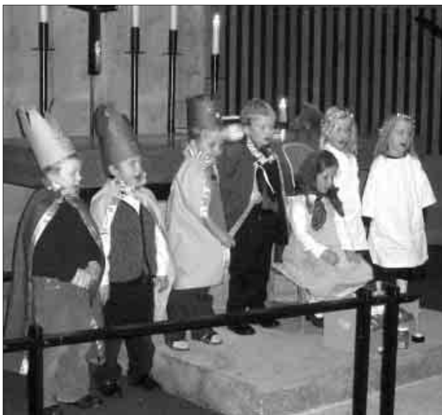
JULESPILL. De eldste barna i Slettebakken menighets barnehage hadde julespill om «Et barn er født i Betlehem».

gudstjenester på julaften, juledag og til julefester.