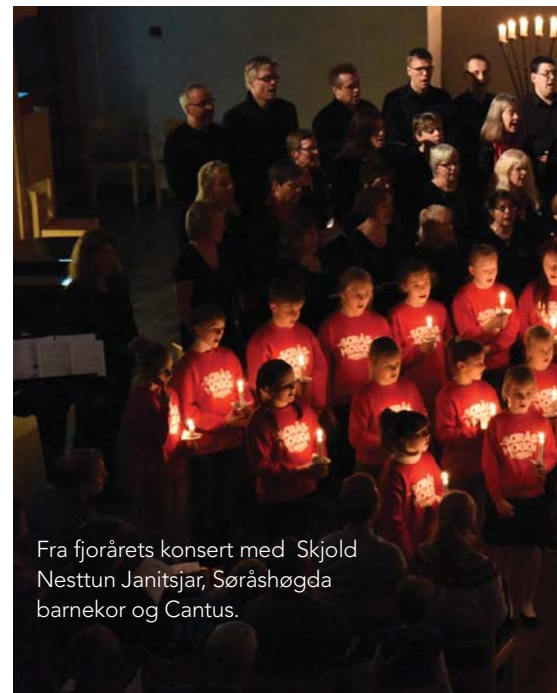
Fra fjorårets konsert med Skjold Nesttun Janitsjar, Søråshøgda barnekor og Cantus.