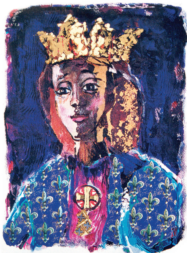
19/20 Håndkolorert/Blodgull "DEN BLÅ SUNNIVA" Marit Stig Amdam 90