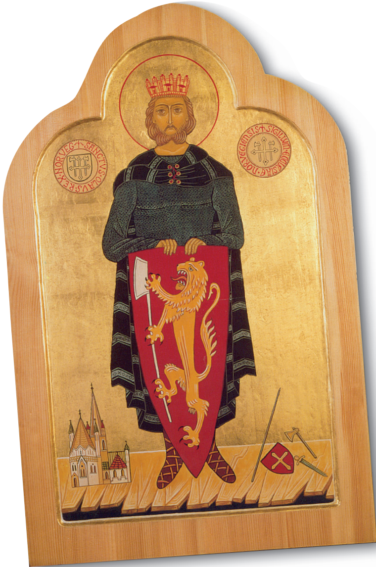
Ikon malt av Hæge Aasmundtveit for Olavsfestdagene i Trondheim 1999.