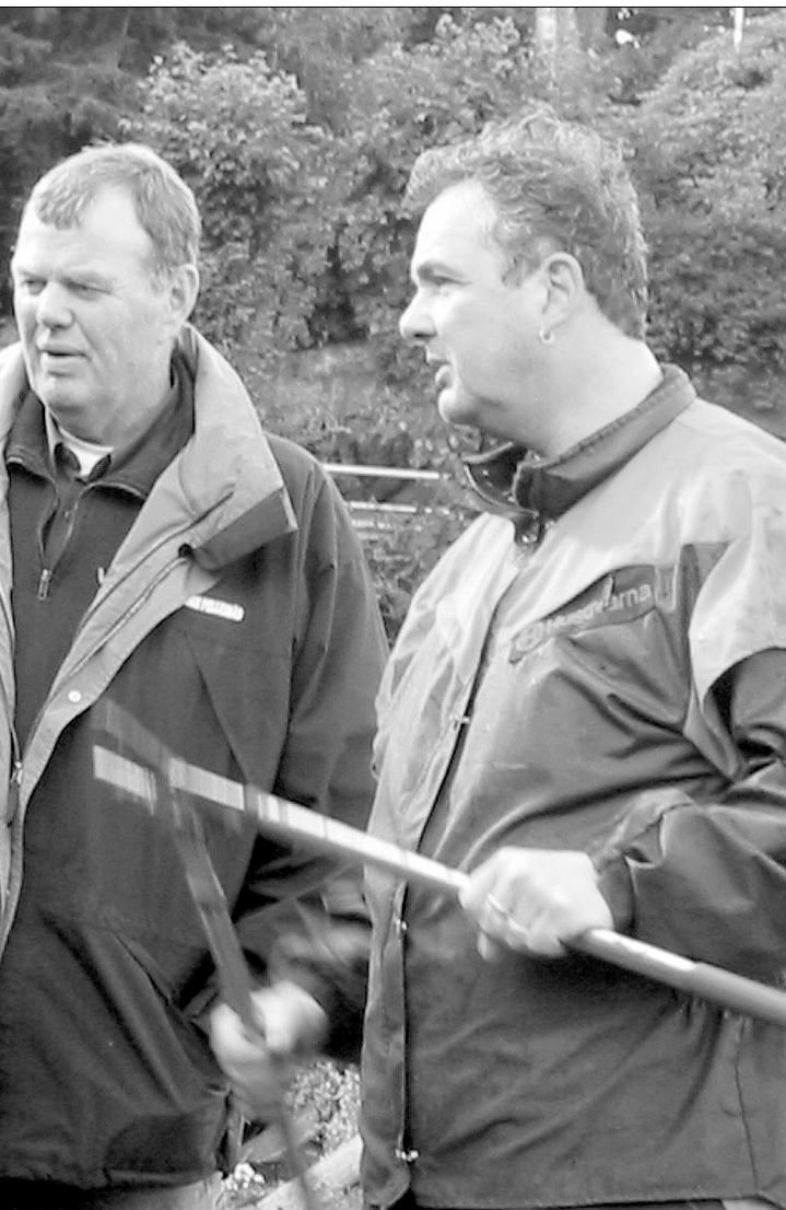
nd Nilsen. Busker beskjæres. Her skal det bli mer lys og luft.

Graver som er eldre enn 25 år må fornyes hvis man ønsker å beholde dem. På kirkegårdene i Fana står det oppslag om dette ved alle utgangene. Mer informasjon om dette kan også hentes på www.bkf.no