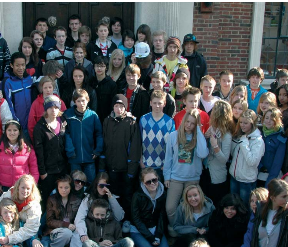
Ungdomsantant i Rotherhide, London.