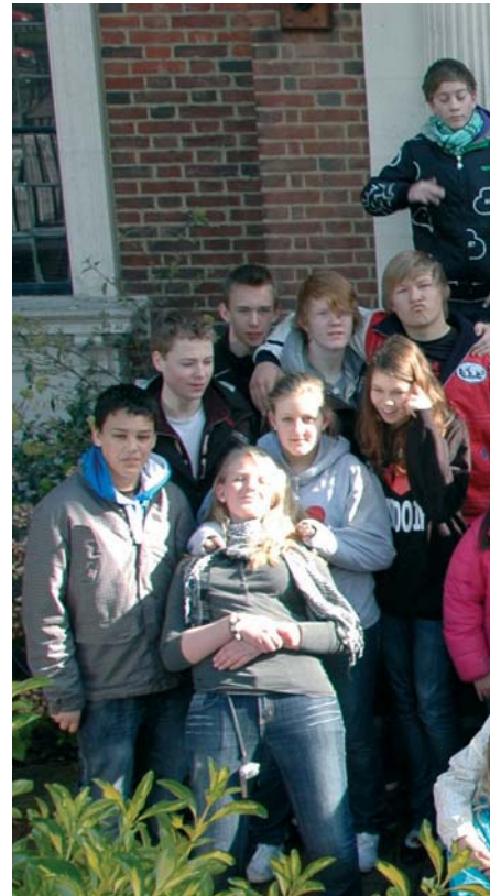
Konfirmantene samlet foran Sjømannskirken.

Vi budde i kyrkja, der vi også fekk servert dei fleste måltida. Det var bibeltimar om kvelden og underholdning, der konfirmantane stilte sporty opp. Vi hadde eit stramt program i fem dagar. Vi var på Madame Tussauds, vi var oppe i London eye, Covent garden