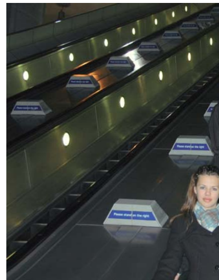
På veg ned i undergrunnen.