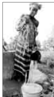
Vann er mer verdt enn gull for kvinnene i Mali.