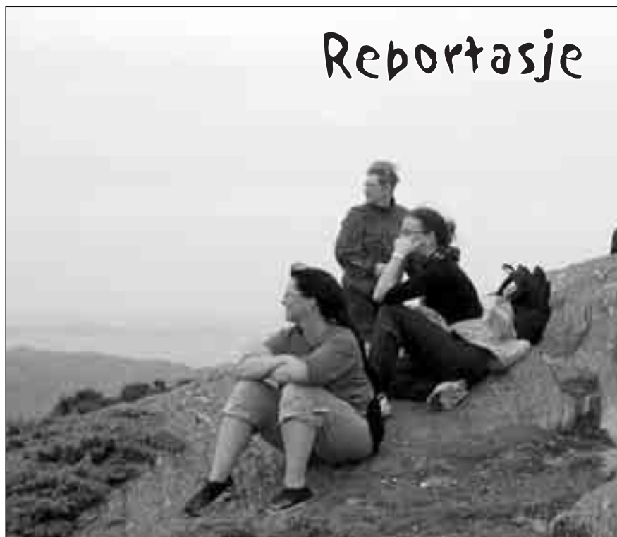
DOBBELT OPP: En fin tur er bra i seg selv, men kombinert med et humanitært prosjekt blir det dobbel gevinst!

Kapasitetsbyggingen er i hovedsak rettet mot lese- og skriveopplæring. En