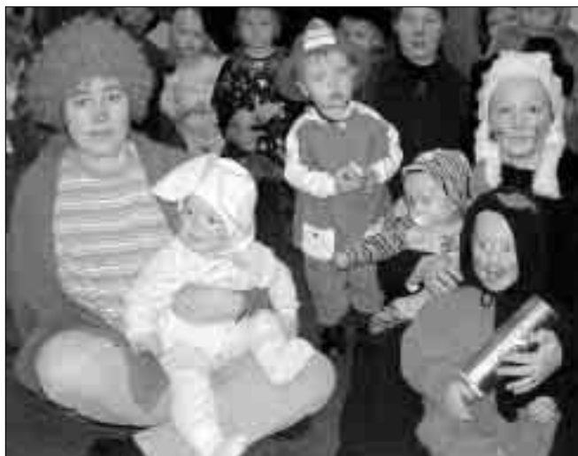
TRIVELIG. Både barn og voksne koste seg under karnevalsfeiringen i barnehagen.

Deretter gikk karnevalstoget med sambarytmer opp til kontorfløyen, der vi ble godt mottatt av sogne-