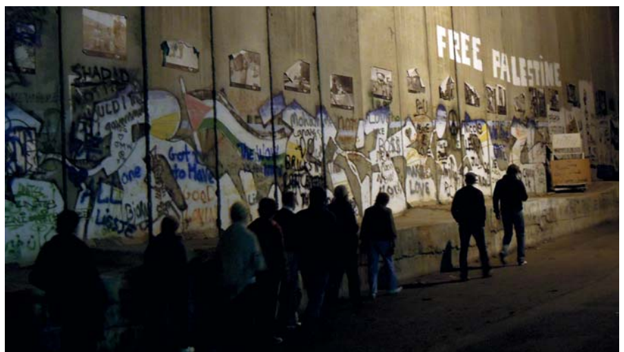
DELT BY: Klokken fem om morgen besøkte vi checkpointet som skiller Betlehem fra Jerusalem. Da var det allerede lang kø med arbeidere på vei til jobb.

hele familien. Etter å ha vært sammen med oss skulle han til sin neste jobb på en restaurant der han ikke var ferdig før ut på ettermiddagen. Det var en åpenhet, varme og et smil i dette hjemmet, samtidig var han urolig for fremtiden, og hvordan familien skulle klare seg.