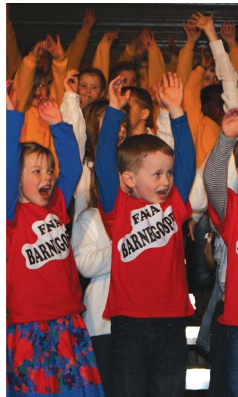
Over: Engasjerte barnegospeltøffinger. T.h. Stor stemning i Nordhordlandshallen!

Da tiden var inne for festivalkonserten var nervene i høyspenn etter timer med intens øving! Det hele ble en kjempesuksess dog vi var ganske trøtte og slitne etter