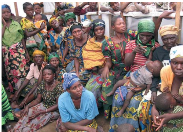
FLYKTNINGER: Kvinner på flukt i eget land, her i leiren Minova utenfor byen Goma.

Sistnevnte har en viktig rolle, og har stor innflytelse. Det gjør inntrykk på folk når den lokale presten holder preken mot familievold, og oppfordrer politiet til å ta seksuelle overgrep på alvor.