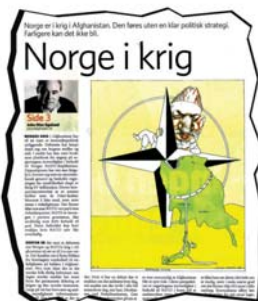
NORGE I KRIG: Dagbladets overskrifter tyder ofte på det.

- Dette er jeg svært glad i, sier hun, reiser seg og deklamerer: