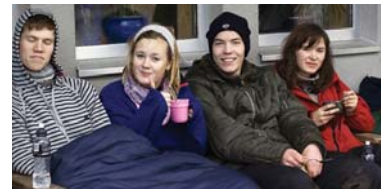
ETTER KONFIRMASJON: Leiartrening, her frå Møre, er eit populært tilbod til dei konfirmer-te.

Det blir også, via Kyrkjerådet, oppmoda til å invitera dei nykonfirmer-te til KonfirmantReunion eller VIDERERE. Opplegga er utforma av arbeidsgrupper med folk frå kyrkjelydar som har gjort egne røynsler med aldersgruppa, og Acta, Bibellesering-en, Blå kors og KFUK-KFUM. Begge gir forslag til innhald, aktivitetar,