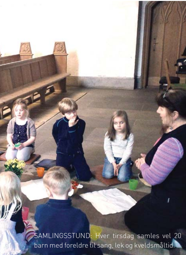
SAMLINGSSTUND: Hver tirsdag samles vel 20 barn med foreldre til sang, lek og kveldsmåltid.