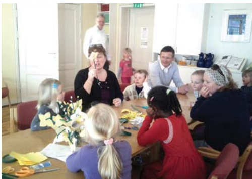
PÅSKELILJEVERKSTED: Fra trosoppføring med seksåringer.

www.ungibjorgvin.no og Facebook: >U2013Ungdomsaretibjorgvin ●