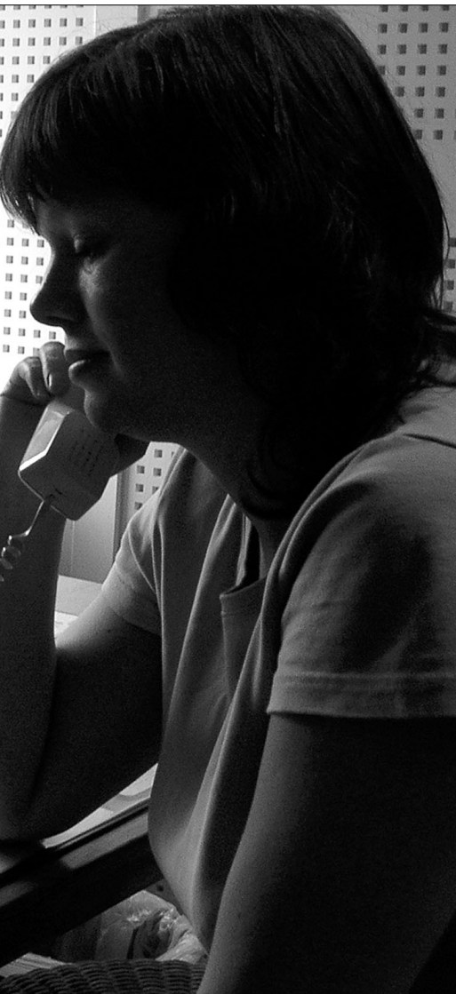
ne bety noe for andre. Dessuten er det et veldig godt felles-