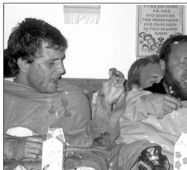
Over: Prester tåler vel en spøk? Under: Kanokos eller kanokaos?

Nå er konfirmantleirene og mesteparten av konfirmanttiden tilbakelagt. Vi håper at ungdommene har fått en positiv opplevel-