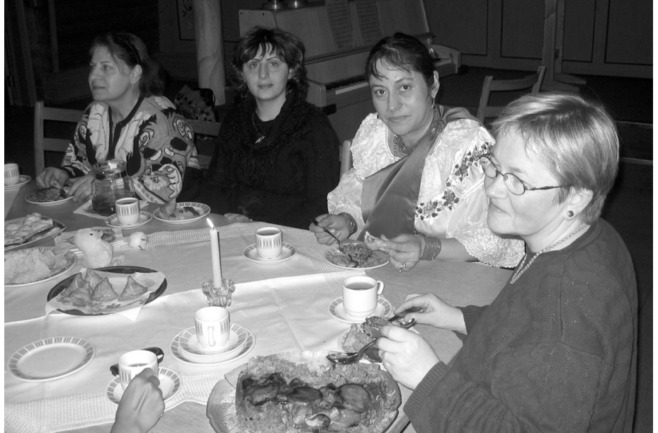
VENNSKAP knyttes rundt matbordet