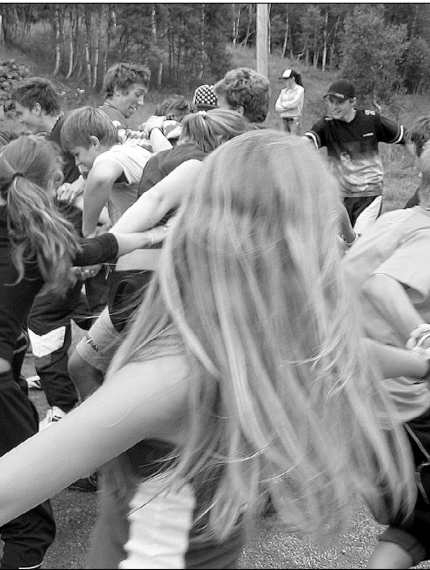
De sosiale aktivitetene er også en viktig del av leirlivet.