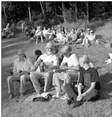
NASJONALSANG på norsk og svensk i Fana amfi (t.v.).