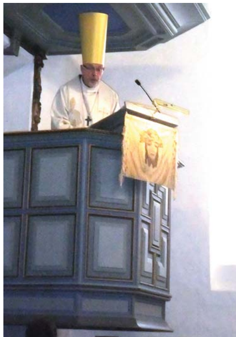
Per prost er en streng Pllatus.