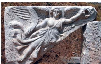
SEIERSGUDINNE: Den greske seiersgudinnen Nike ble tilbedt i Efesos. I dag hylles hun av joggere og sprintere over hele verden.

kom til Efesos (se Apg. kap. 19). Han ble årsak til store opptøyer, siden han forkynte Jesus framfor Artemis. Hans preken kostet ham nesten livet. Efesos nevnes også i Johannes åpenbaring (Åp. 2:1-7), samt nabo-byen Smyrna (Åp. 2:8-11).