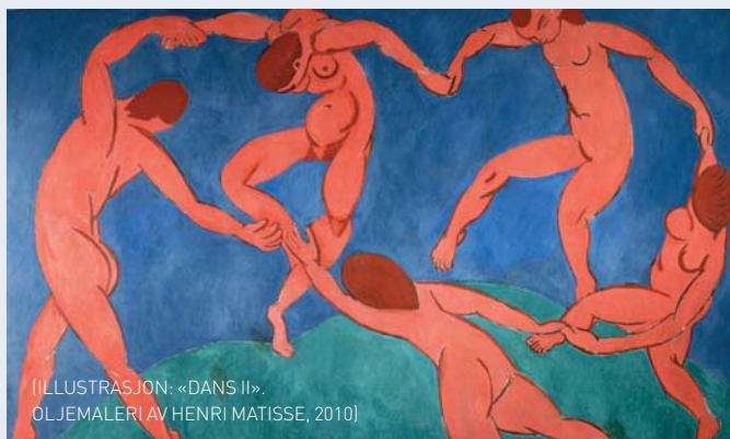
(ILLUSTRASJON: «DANS II», OLJEMALERI AV HENRI MATISSE, 2010)

• «Da jeg så tempelet til Artemis som steg opp til skyene, mistet alle de andre underverk sin glans» skrev Antipatros av Sidon, som satte opp listen over oldtidens syv underverker. ●