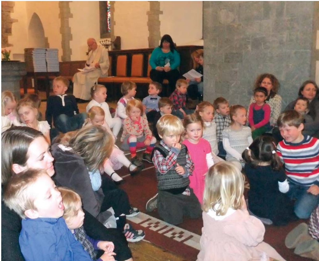
Konsentrerte fireåringer og foreldre