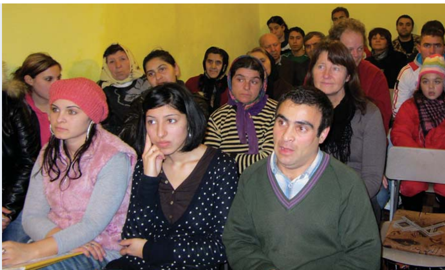
GUDSTJENESTE I BOIU: Små og store gjør seg klare til gudstjenesten i det trange kirkerommet.