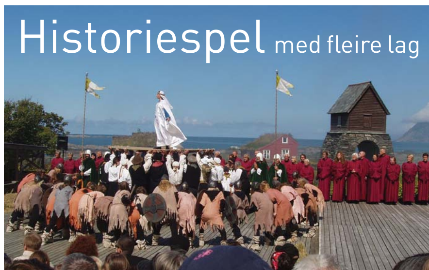
SPEL I SPELET: Den irske prinsessa Sunniva ber Gud om hjelp til å flykte frå klørne til vikingkongen Ramn.

– Kinnaspelet har havet og himmelen som bakteppe og blir spela i eit naturleg amfi under fjellet. Det finst finst ikkje maken, seier prost, seier prost Per Barsnes, som i fleire år har vore reiseleiar til det historiske spelet.