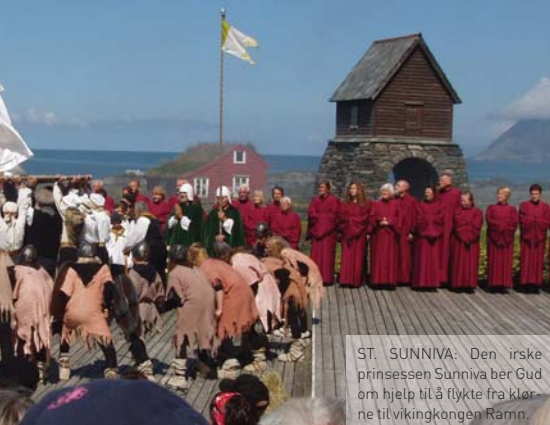
ST. SUNNIVA: Den irske prinsessen Sunniva ber Gud om hjelp til å flykte fra klørne til vikingkongen Rarnn.