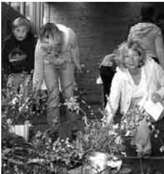
Deltakerne på gudstjenesten fikk utdelt spirende kvister: Det handler om «det nye livet».

Tross øsende regn og kraftige vindkast – grilling og aktivitet ble det! I stedet ble det samling inne og grilling under tak, og det ble servert både pølser, hamburgere og brus – til stor glede for de fremmøtte.