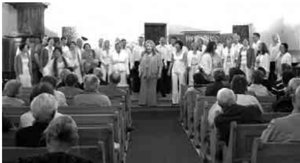
Sola Fide holdt separatkonserter i Abbey de Montheron utenfor Lausanne.

Vi bodde i Vevey, den lille nabobyen til Montreaux. Hotellet vårt, hotell de Lac, lå like