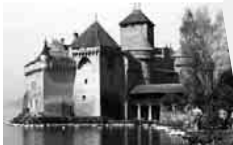
Chateau de Chillon er Sveits' mest besøkte turistattraksjon.