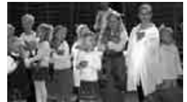
Hjellestad og Milde søndagsskole synger.

Som vanlig var det i år lagt opp til en variert og underholdende gudstjeneste med bidrag fra flere forskjellige grupper og enkeltpersoner – alt fra skuespill og sang fra søndagsskoleelevene til teknisk ekspertise til styring av lyd og lys fra «Blessing» sin mediagruppe.