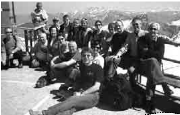
En fin gjeng nyter vårsolen i over 2000

innholdsrike borgen etter kart, med mange og tredve saler og rom og tårn – og overalt var det fantastisk akustikk til diverse sang-improvisasjoner. Det var lystig og herlig og andaktsfullt – alt på en gang. Så bar det ut i solen igjen, og rusletur tilbake mot byen.