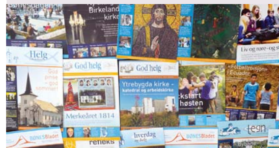
ALLE BLADENE PÅ NETT: Bladene for alle menighetene like fra 2003 er nå samlet og gjort tilgjengelig på internett. Her ligger det mye godt lesestoff, og du finner helt sikkert mange folk du kjenner hvis du blar litt i bladene.