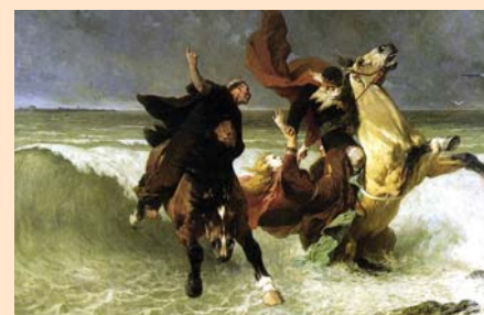
LEGENDEN OM YS: Kong Gradlon skyver den onde datteren Dahut i havet og flykter fra Ys før byen synker i havet. Ifølge legenden kan man fortsatt høre klokkene ringe fra byens sunkne katedral. (ILL.: «KONG GRADLONS FLUKT». MALERI AV ÉVARISTE VITAL LUMINAIS, 1884)