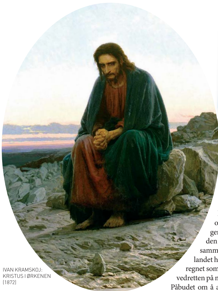
IVAN KRAMSKOJ: KRISTUS I ØRKENEN (1872)

Europa, der våren kom tidligere enn her lenger mot nord.