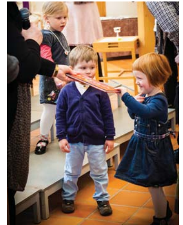
FÅR FIREÅRSBOK: Når barna er fire og seks år gamle, inviteres de til å motta bok i gudstjenesten.

Trosopplæringsplanen til Bønes menighet tar også for seg de kontinuerlige tiltakene i menigheten, og ser på det arbeidet som en viktig del av den helhetlige trosopplæringen. Vi har søndagsskole, menighetsbarnehage, Minising, Tria, TenSing og ungdomsklubb. Minising er et kor for barn fra 3-6 år, mens Tria er et tilbud for 2.-7. klasse med vekt på sang, musikk og andakter. Det er også en stor speidergruppe på Bønes, som er tilknyttet kirken og menighetslivet. Det er mye aktivitet i Bønes kirke, også for barn og unge. Vi har et aktivt trosopplæringsutvalg som i samarbeid med menighetsråd og stab holder trosopplæringsplanen ajour, forbereder oppstart av flere tiltak og støtter opp om eksisterende arbeid. Slik holder vi fokuset på trosopplæringsreformen, som er en viktig del av arbeidet i Bønes menighet. ●