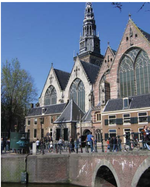
AMSTERDAMS ELDSTE: Oude kerk («gamlekirken») ble innviet i 1306.