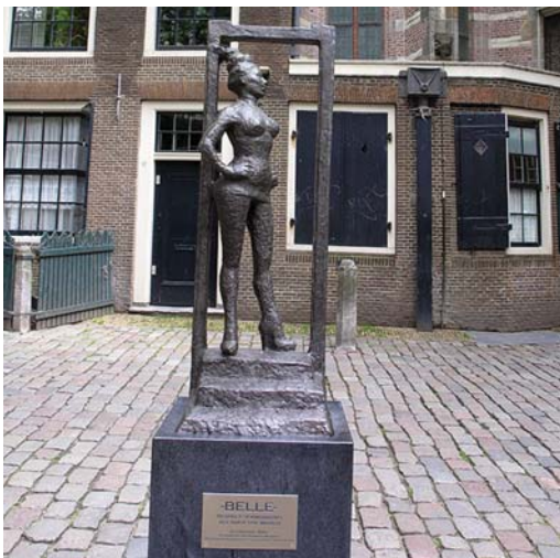
KONTRASTENES BY: Foran Oude kerk er det satt opp en bronsestatue av en prostituert med tittel «Belle» og innskriften «Respect sex workers all over the world».