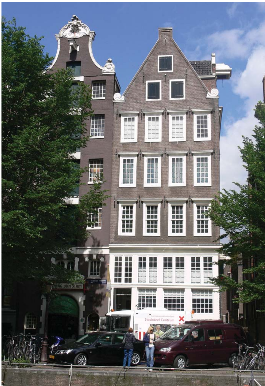
KANALHUS BLE KIRKE: I årene 1661-1663 ble de tre øverste etasjene i dette huset tatt i bruk som kirke.

Vi vandret lenge gjennom museet med autoguide på øret og fikk servert ikke bare historikken, men også en del om restaureringen som pågår og om hvordan løse problemet med å skåne et gammelt bygg uten å være for restriktive overfor de mange tusen som besøker stedet hvert år (jevnfør vår egen turistmagnet Trolldaugen). I 1887 ble en ny, stor katolsk