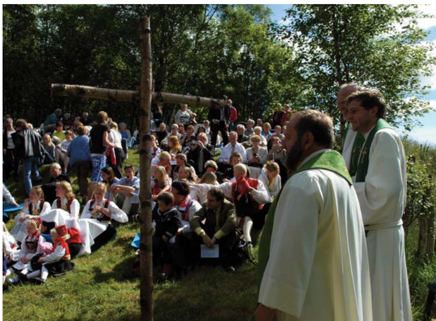
Her skal den nye nærkirken bygges. Bildet er tatt ved en sommergudstjeneste på kirketomten.

Når vinnergruppen er kåret vil videre fremdrift være som følger: