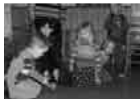
Gjennom leik og aktivitet får barna kunnskap om kristen tru

skapte av Gud og at Han er glad i kvar enkelt, og ofte kan det vere til hjelp å bruke andre måtar enn å berre prate.