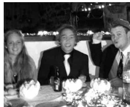
God stemning rundt et festpyntet bord med mye