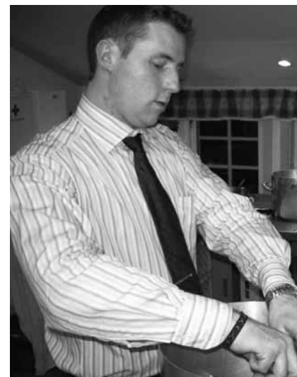
Ikke noe å si på innsatsen, men antrekket er nok