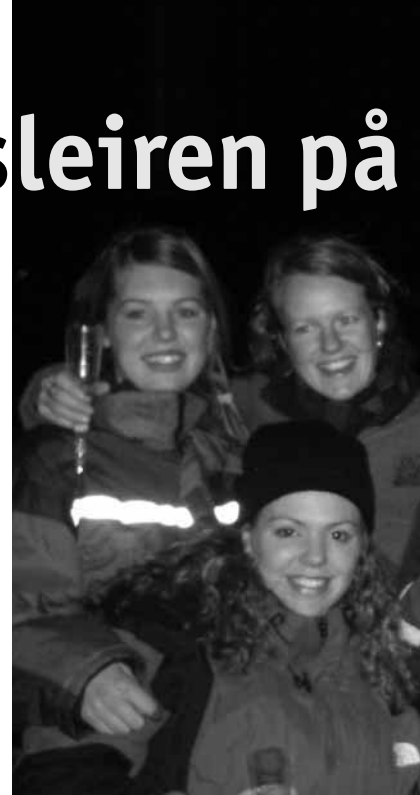
Skål for et godt nyttår! (Mozell naturligvis...)

Vi avsluttet årets siste dag med en samling om Guds ord, og startet det nye året med bønn for hverandre og for året som ligger foran oss. Dette var en flott og innholdsrik helg, og leir er leir ... så trøtte, men med mange gode minner og opplevelser returnerte vi til Bergen utpå ettermiddagen 1. nyttårsdag. ●