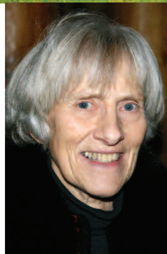
PRIMUS MOTOR SIDAN STARTEN: