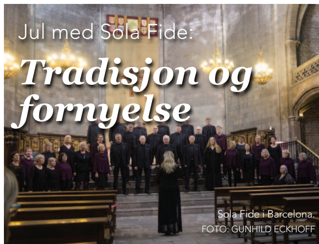
Sola Fide i Barcelona.