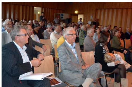
STORT FREMMØTE: Et fullsatt menighetshus fikk høre og stille spørsmål til byens toppolitikere, som stilte til debatt under temaet «Kirken som ressurs i Bergens hverdag».