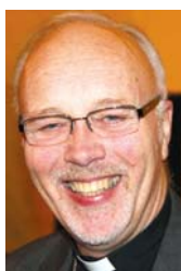
AV PER BARSNES

Måndag 12. september var valdag for fire ulike val: Val til bystyret, val til fylkestinget, val til soknerådet og val til bispedømerådet.