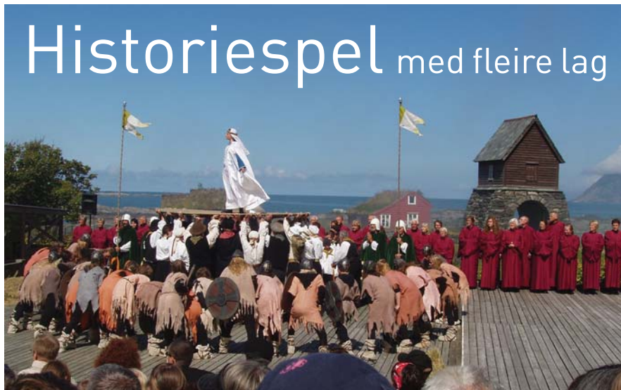
SPEL I SPELET: Den irske prinsessa Sunniva ber Gud om hjelp til å flykte frå klørne til vikingkongen Ramn.

– Kinnaspelet har havet og himmelen som bakteppe og blir spela i eit naturleg amfi under fjellet. Det finst finst ikkje maken, seier prost, seier prost Per Barsnes, som i fleire år har vore reiseleiar til det historiske spelet.