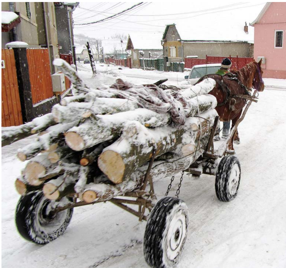
KONTRASTENES LAND: Hesten blir fortsatt mye brukt i Romania, spesielt av sigøynere. Til høyre: Boiu. Her vil de starte en barnehage, og menigheten trenger sårt til et større lokale.

Vel ute av flyet trekker jeg dypt inn den klare luften med lukten av Romania. Siden 2005 har vi reist hit flere ganger hvert år, og vi blir mer og mer glad i dette vakre landet med de latinske røttene. Mens jeg står i egne tanker, har Eivind ordnet med leiebil, og like etter er vi på vei mot vårt første stopp; byen Medias, som ligger nokså midt i landet. Det å kjøre bil er ganske utfordrende. Rumenerne har en tendens til å lage sine egne regler. Er veien brei nok, lager noen gjerne et ekstra felt i en eller begge retninger. Dessverre medfører