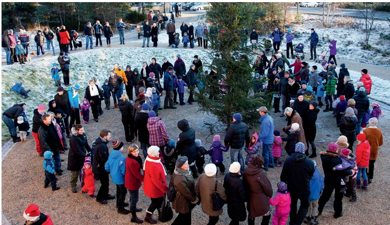
Mange mennesker var samlet til gang rundt juletreet.