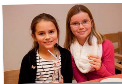
Kaker og brus på juletefesten.