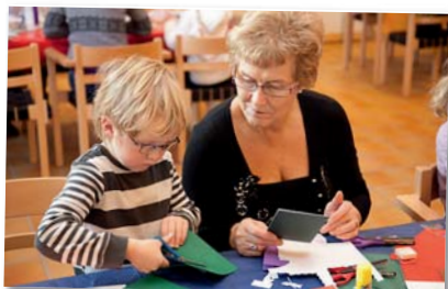
Kjekt å samles på adventsverkstedet.