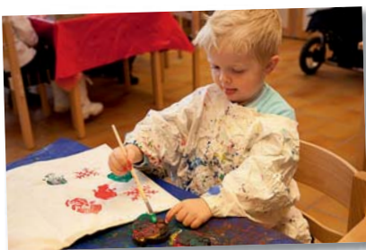
Mange fine julegaver ble laget på adventsverkstedet.