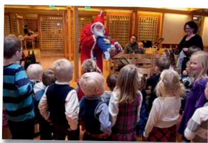
Nissen besøkte også juletefesten.